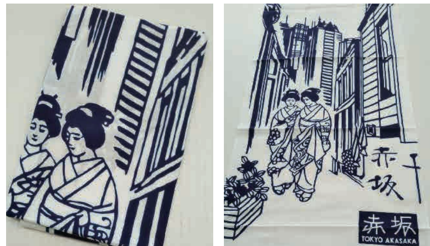
▲サイズは横36cm・縦90cm/1,500円(税込)

まだデザインは1種類しかないですが、人気次第で種類を増やしていくことも検討しているようです。1枚1,500円(税込)、地元のホテルなどで販売しています。ぜひお手にとってみてください。購入希望の方は、港区商店街連合会(TEL:03-3578-2555)までお問い合わせください。