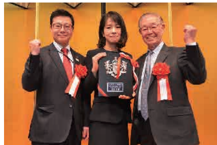
▲昨年の港区長賞はニュー新橋ビル一階商店会の「エルメ・ド・ボーテ新橋店」

令和元年度港区商店グランプリのテーマは「お客様に喜ばれるお店づくり」。各商店会から8店舗がエントリーし、10月21日（月）に中小企業診断士の柳田譲先生の他、港区民などで構成された審査員で実地巡回審査を行いました。表彰式は新年賀詞交歓会席上で実施となります。