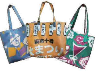
▲麻布十番商店街のフラッグ・バッグ /1,500円(税込)

このフラッグは「フラッグ・バッグ」としてリサイクル活用されています。この取り組みは、「フラッグ・リユースプロジェクト」として、障害者福祉と地域の活性化を担う商店街が協力して行っています。