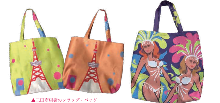
▲三田商店街のフラッグ・バッグ

また、三田商店街振興組合でも同様の取り組みをスタート。三田ならではの東京タワーやサンバカーニバルの絵柄が人気のようです。お問い合わせは工房ラビール(電話:03-5843-7939)