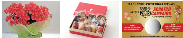
▲白金プラザ会参加店舗の「店舗賞」も種類が豊富