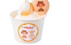
▲のむ milky hot ベコのおすすめはちみつフレーバー