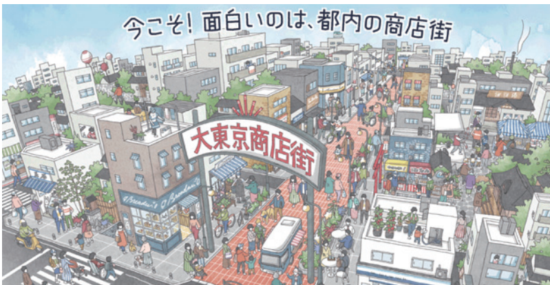
▲「大東京商店街まつり」トップページ

商店街の魅力や地域で担っている役割を広くアピールし、都内商店街の中長期的な活性化を図ることを目的として、「大東京商店街まつり」を特設ホームページで開催しています。参加商店街の紹介とともに、商店街の逸品を購入できる期間限定ECサイト、SNSを活用した参加型のコンテンツなど、デジタルの力を活用して都内商店街の魅力を発信中です。