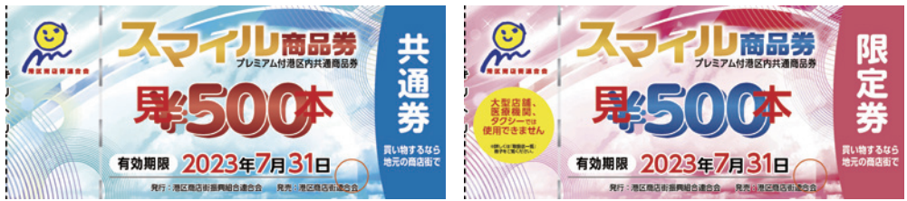
▲2月発行の紙商品券「共通券」のデザイン