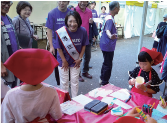
▲子ども商店体験で頑張る子どもたちに声をかける清家愛港区長