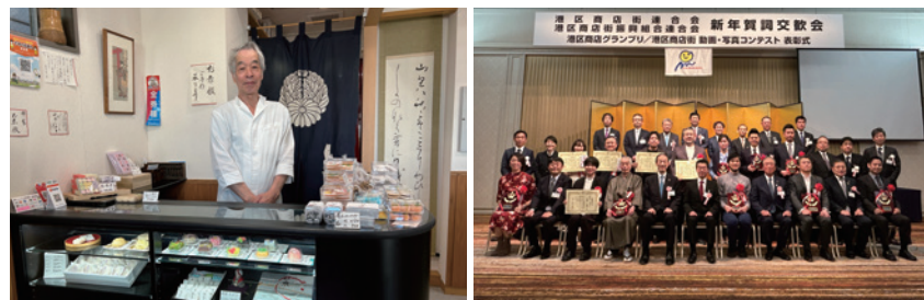
(左) 昨年度、港区長賞を受賞した青山表参道商店会の「葉匠 菊家」 (右) 表彰式後には全員で記念撮影