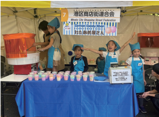
▲わたあめを作ったり大きな声で呼び込みを行いました

10月12日(土)・13日(日)の2日間、みなと区民まつりバザール部会にて、毎年恒例の「子ども商店体験」が開催されました。 今年も募集開始から応募が殺到し、厳正なる抽選の結果90名の子どもたちが参加。2日間とも天候に恵まれ、楽しい雰囲気の中、無事に終えることができました。 当日は、「わたあめ屋さん」「チュロス屋さん」「ポップコーン屋さん」の3チームに分かれ、それぞれ大人スタッフのサポートのもと、お店を開く準備から、販売、売上の集計までを子どもたち自ら行いました。幅広い学年の子どもたちが参加していましたが、高学年の子が低学年の子に教えたり、助けたりする場面が多くみられ、子どもたち同士協力して動く姿がとても印象的でした。また、各チーム自分たちで「どう