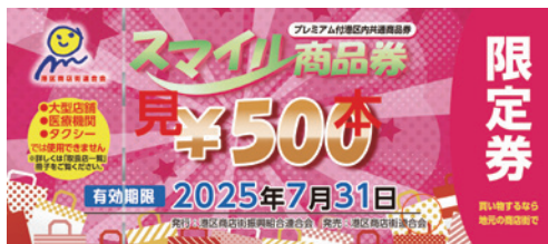
▲2月発行の紙商品券「限定券」のデザイン