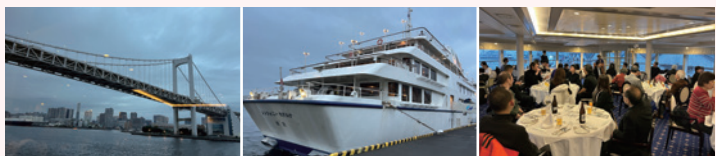
▲(左)レインボーブリッジ (中)シンフォニーモデルナ号 (右)3F ボロネーズを賞切

昨年11月10日(日)に港区商店街連合会のレクリエーション事業として、商店会関係者63名が参加し、「東京湾シンフォニークルーズ」が行われました。日の出桟橋を16:30に出航し、レインボーブリッジを通過後、お台場、品川ふ頭へと進み、東京ディズニーランドや羽田空港の景色などを堪能。また美味しいコース料理にも舌鼓を打ちました。あいにく小雨の散らつく天気だったため、サンセットクルーズの醍醐味である夕日に染まる幻想的な風景は見られませんでした。商店会の垣根を超えて親睦を深めることができたレクリエーションとなりました。