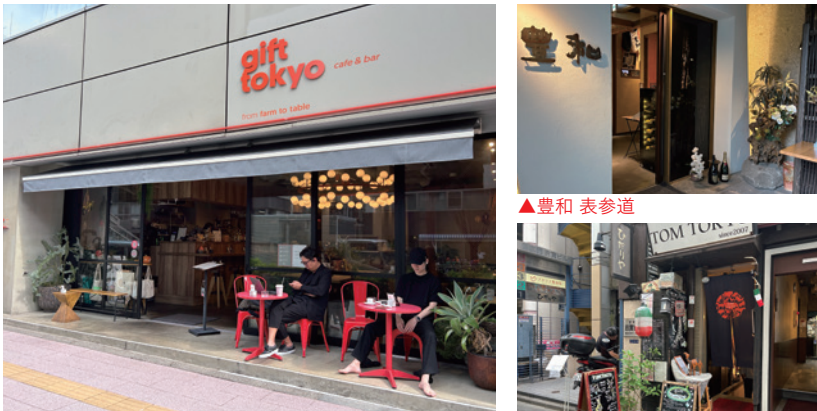
▲gift tokyo cafe&bar