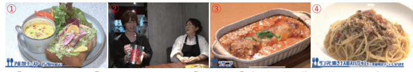
▲①アボカドトースト ②ガネーシャのせんべい ③ラザニア ④秋刀魚と焼き茄子を使ったスパゲッティ

両動画ともに商店街の魅力が存分に詰め込まれており、思わず足を運びたいような動画となっています。気になる第3回目もぜひチェックしてみてください。