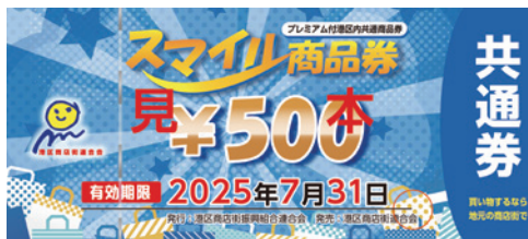
▲2月発行の紙商品券「共通券」のデザイン